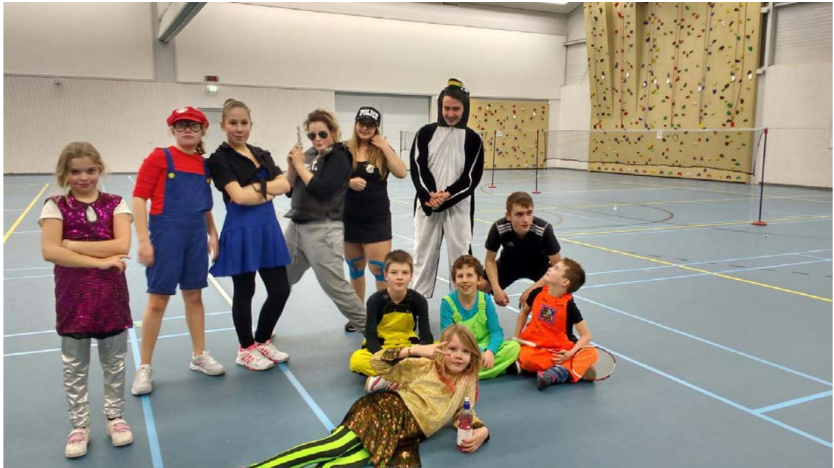
Carnavals badminton van groep 1 en 2