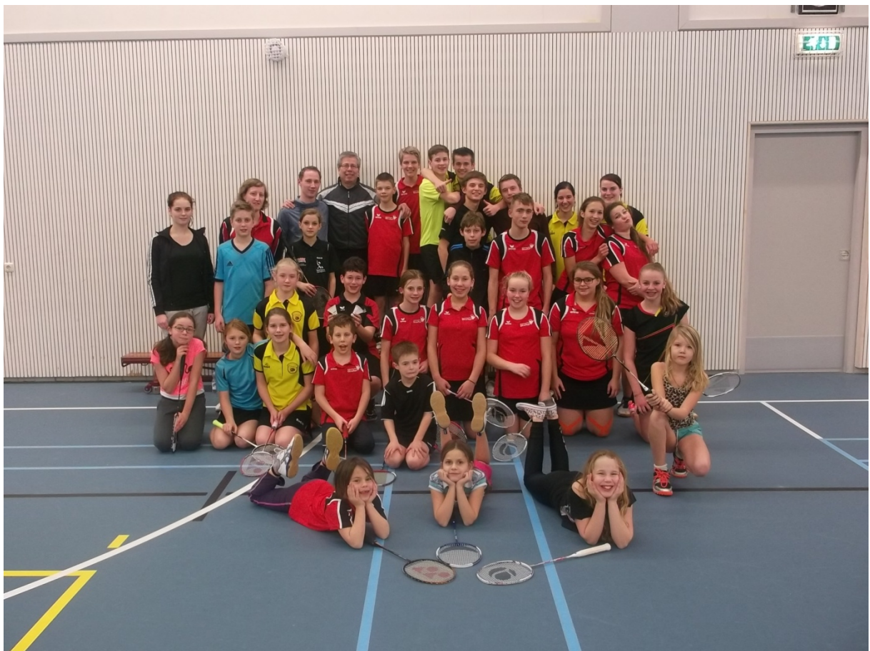
Geslaagde uitwisseling met Son en Breugel.