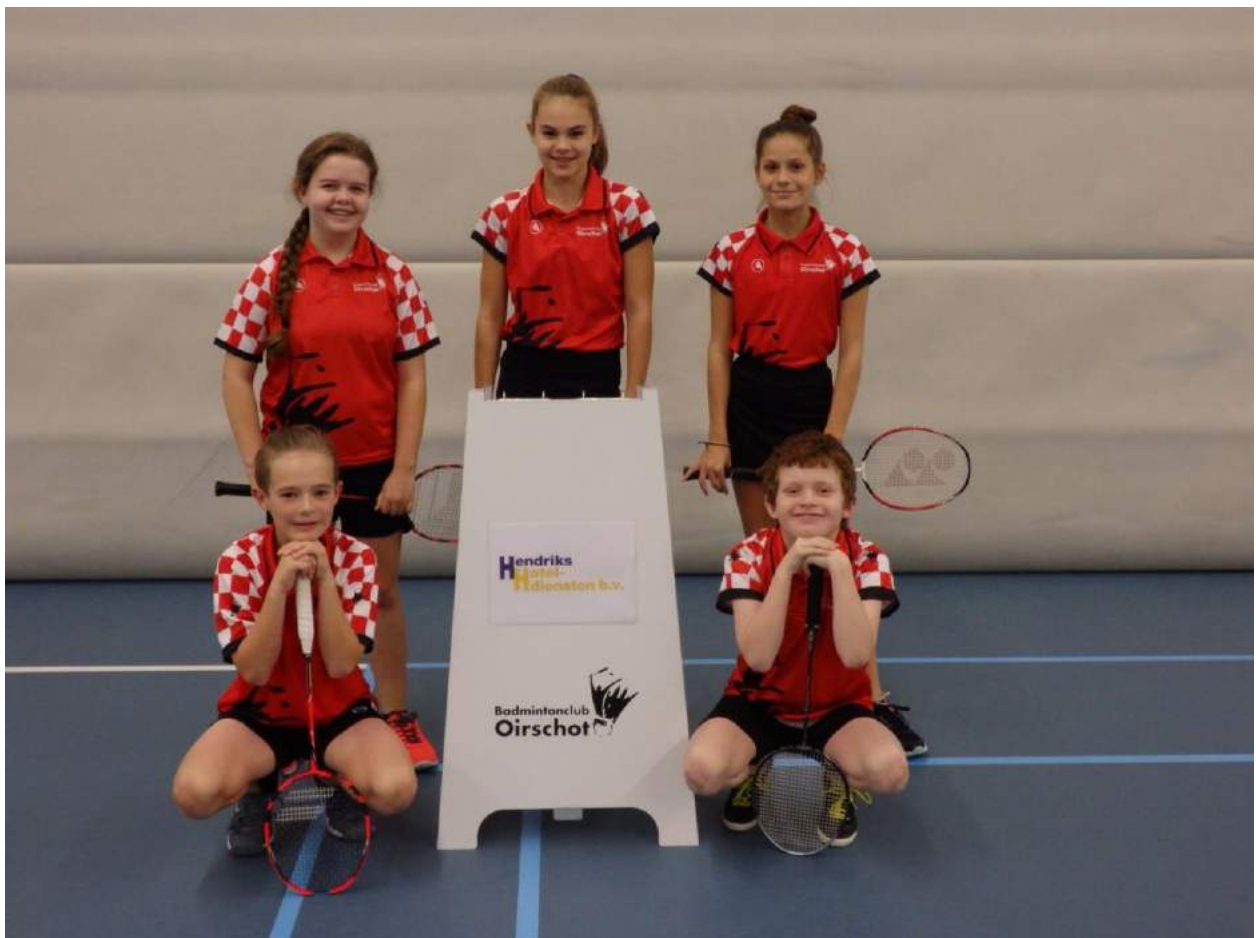
Team U13 mix